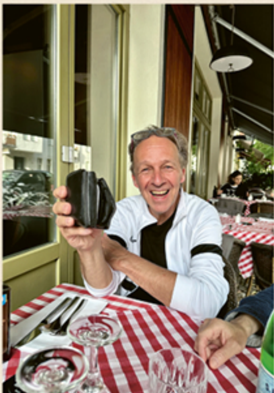
Lotto-Lutze im Glück!

Monate später war sein großer Tag gekommen und nach einer fulminanten Hochzeitsfeier war er schließlich „unter der Haube“. Im Anschluss sahen wir uns dann immer wieder mal. Irgendwann eröffnete ich ihm dann auch, dass ich mit dem Gedanken spielen würde, meine Firma zu verkaufen, was ich schließlich auch tat. Von nun an sprachen wir bei unseren weiteren Treffen nur noch darüber, wieder zusammen in einer Band spielen zu wollen.