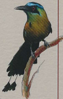
3. Motmot di Trinidad ( Momotus bahamensis )