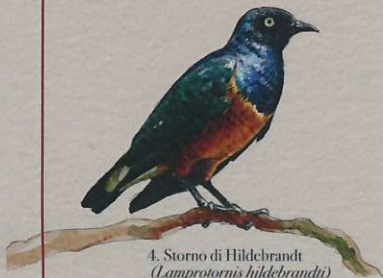
4. Sturno di Hildebrandt ( Lamprolornis hildebrandti )