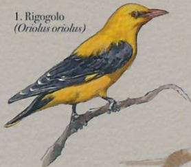
1. Rigogolo ( Oriolus oriolus )