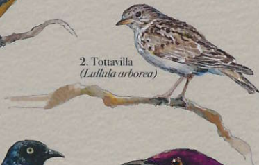
2. Tottavilla ( Lullula arborea )